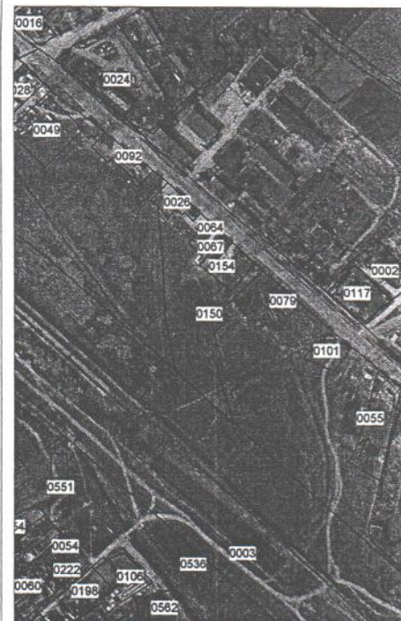
0150 - numărul terenului